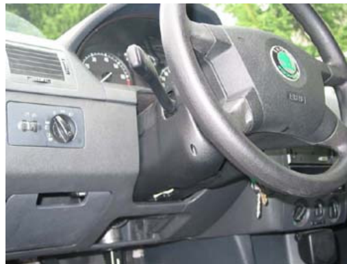
Zederlock vo Fábii