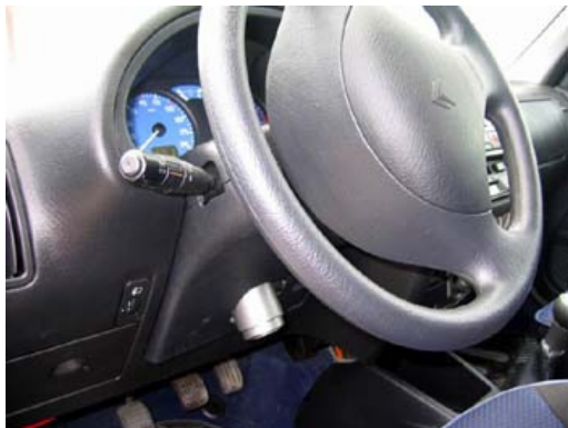
Zederlock v Citroene

Elegancia Zederlocku rozhodne nebolo niečo, čomu by výrobca venoval najvyššiu prioritu. Našťastie vo väčšine áut je zariadenie ukryté tak, že nenarúša letný pohľad do interiéru, niekde ho takmer nevidieť. Pri niektorých autách je však časť zámku viditeľná viac, čo detailistom môže trochu prekážať. Ak by sa výrobca pohral aj s povrchovou úpravou zariadenia, nebolo by to určite na škodu. Viditeľná časť v interiéri by sa tak mohla stať menej rušivou.