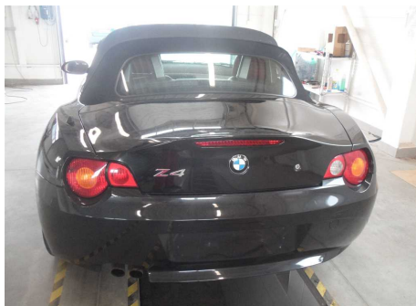
zadná časť vozidla