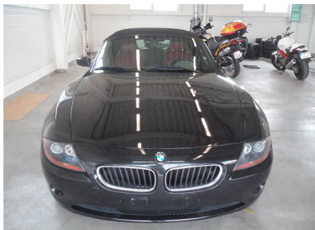
predná časť vozidla