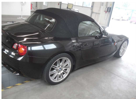
pravá strana vozidla