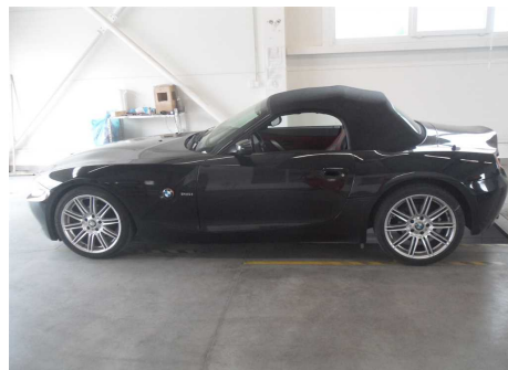
ľavá strana vozidla