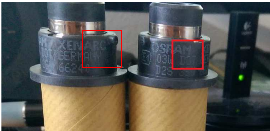
OSRAM 22640 , Original