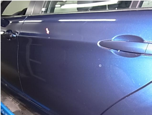
7. Tür hinten links Kratzer smartrepair